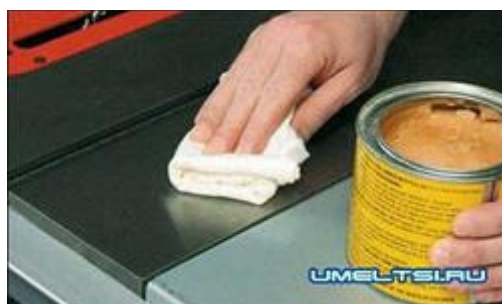
Рис. 2.1. Нанесение специального покрытия для защиты от коррозии [3, С.10]

1 – система подготовки газов; 2 – система дозирования; 3 – колонка; 4 – система термостатирования; 5 – система детектирования; 6 – блок питания детектора; 7 – усилитель сигнала детектора; 8 – регистратор (компьютер)