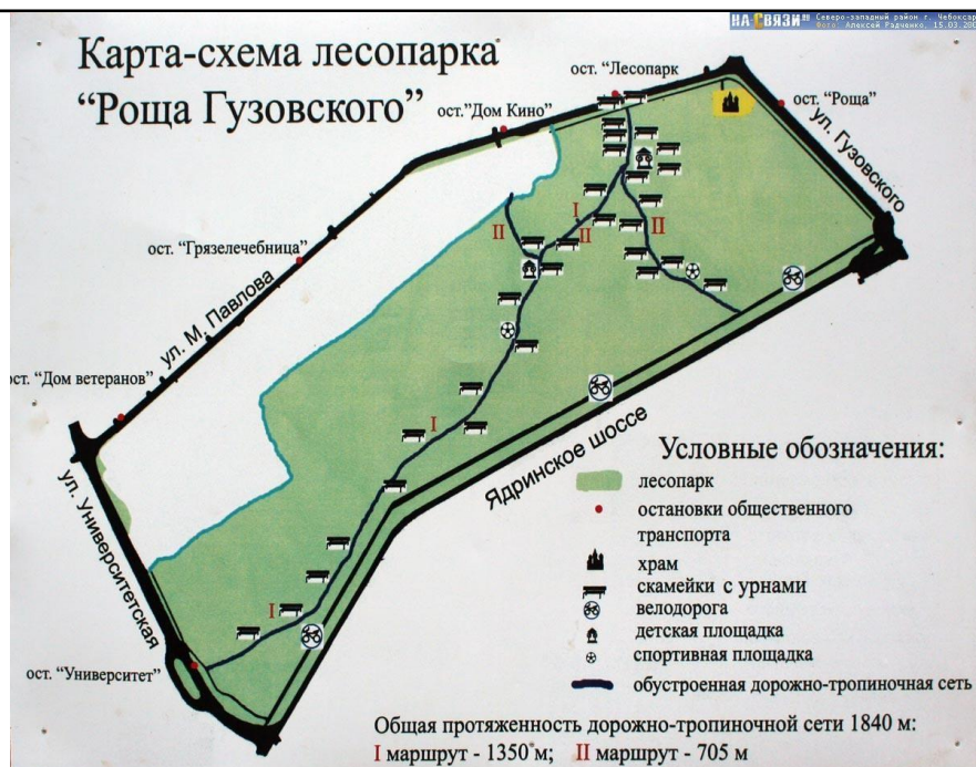
Рисунок. Карта-схема лесопарка «Роща Гузовского»