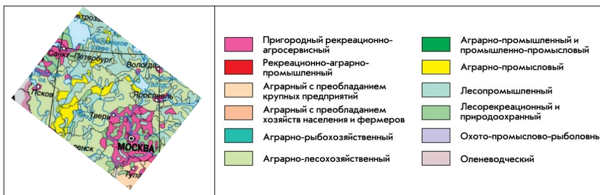
Рис. 1. Фрагмент карты «Типы сельской местности» в Национальном атласе России (т. 3, 2008. С. 136–137). URL: http://xn--80aaaa1bhncclci1cl5c4ep.xn--p1ai/cd3/136-137/136-137.html